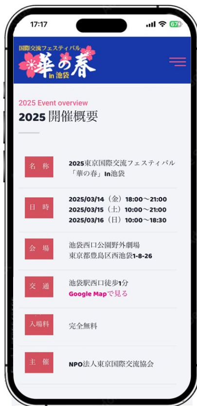
華の春 公式サイト