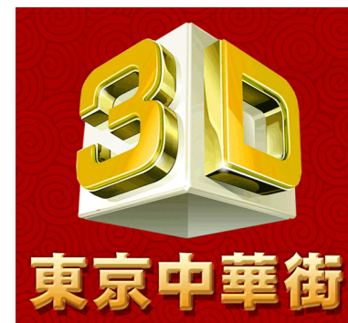
VRオンライン展示会